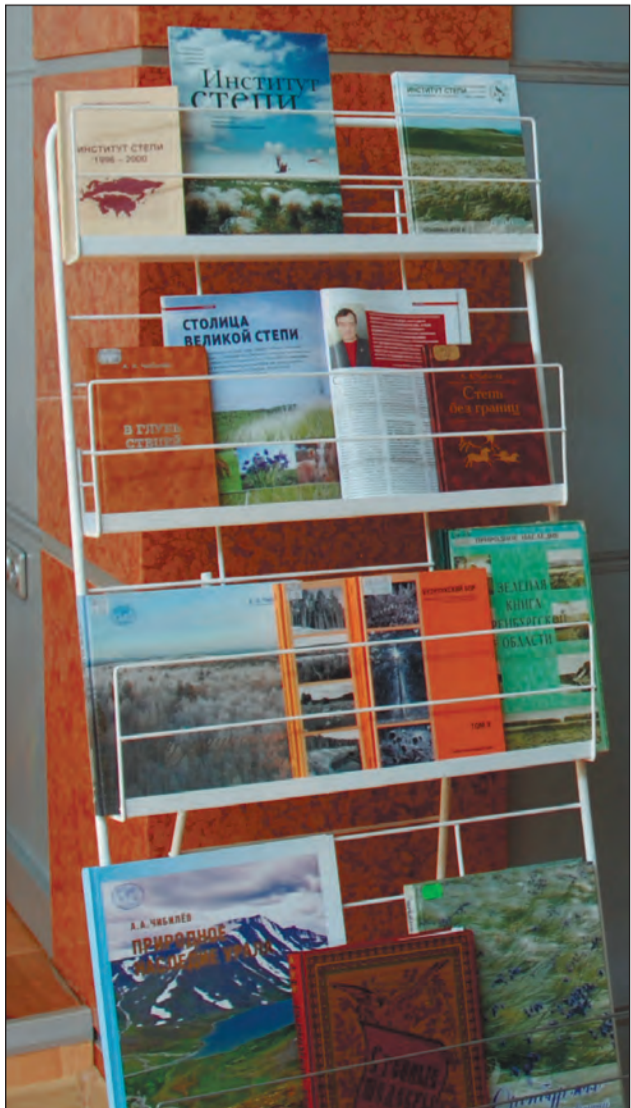
Подборка литературы о степи