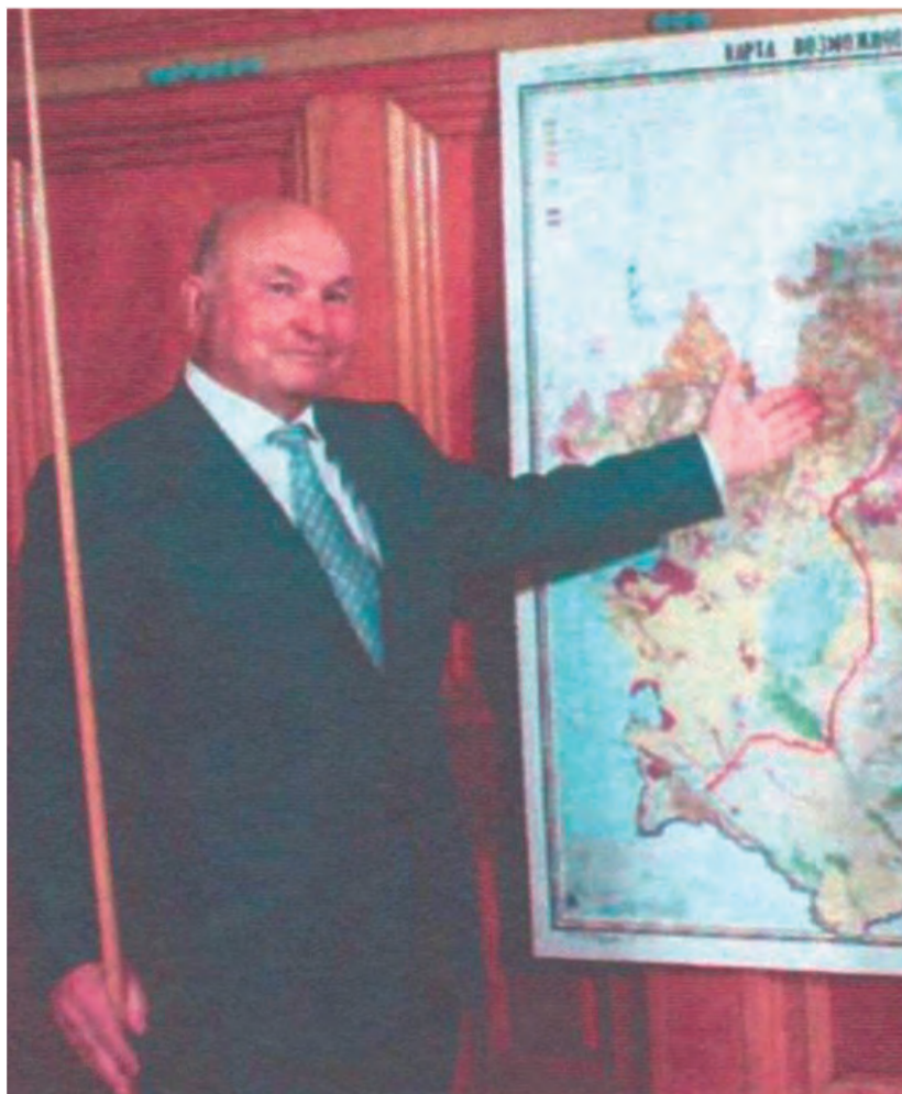
Ю. М. Лужков у карты переброса части стока сибирских рек

«По прогнозам ученых, в XXI веке проблема пресной воды станет главным источником глобальных конфликтов, перерастая в главный лимитирующий фактор развития человечества. Современные технологии водопользования и масштабы их применения серьезно увеличивают загрязнения воды и сокращают водные ресурсы, пригодные для питьевого, бытового, сельскохозяйственного и технического использования. Это углубляется интенсивным ростом населения, причем в основных регионах, характеризующихся именно нехваткой пресной воды. Поскольку масштабных системных мер по приостановке этой тенденции не предпринимается, проблема истощения мировых запасов пригодной к употреблению воды в течении ближайших лет может стать (и для дальновидных деятелей фактически уже стала) проблемой человечества.»