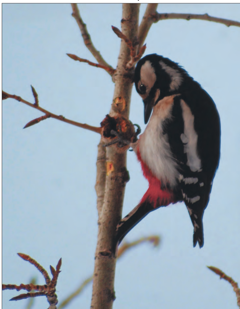
Большой пестрый дятел