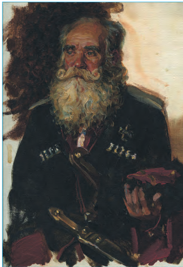
«Старик казак» рисунок А. Коробкина

Общение со стариками требовало определенного знания правил вежливости. Младший никогда не обращался к старшему без предварительного разре-