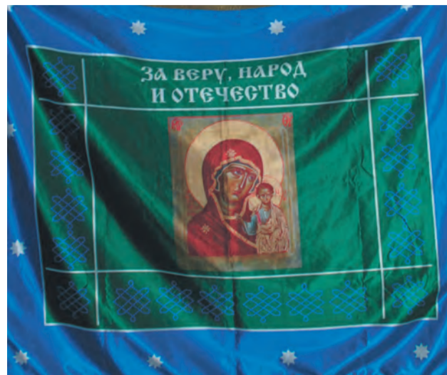
Лицевая и оборотная стороны Пономаревского знамени

З намя с давних времен являлось для казаков одной из святынь. Не зутратило оно своей ценности и в наши дни.