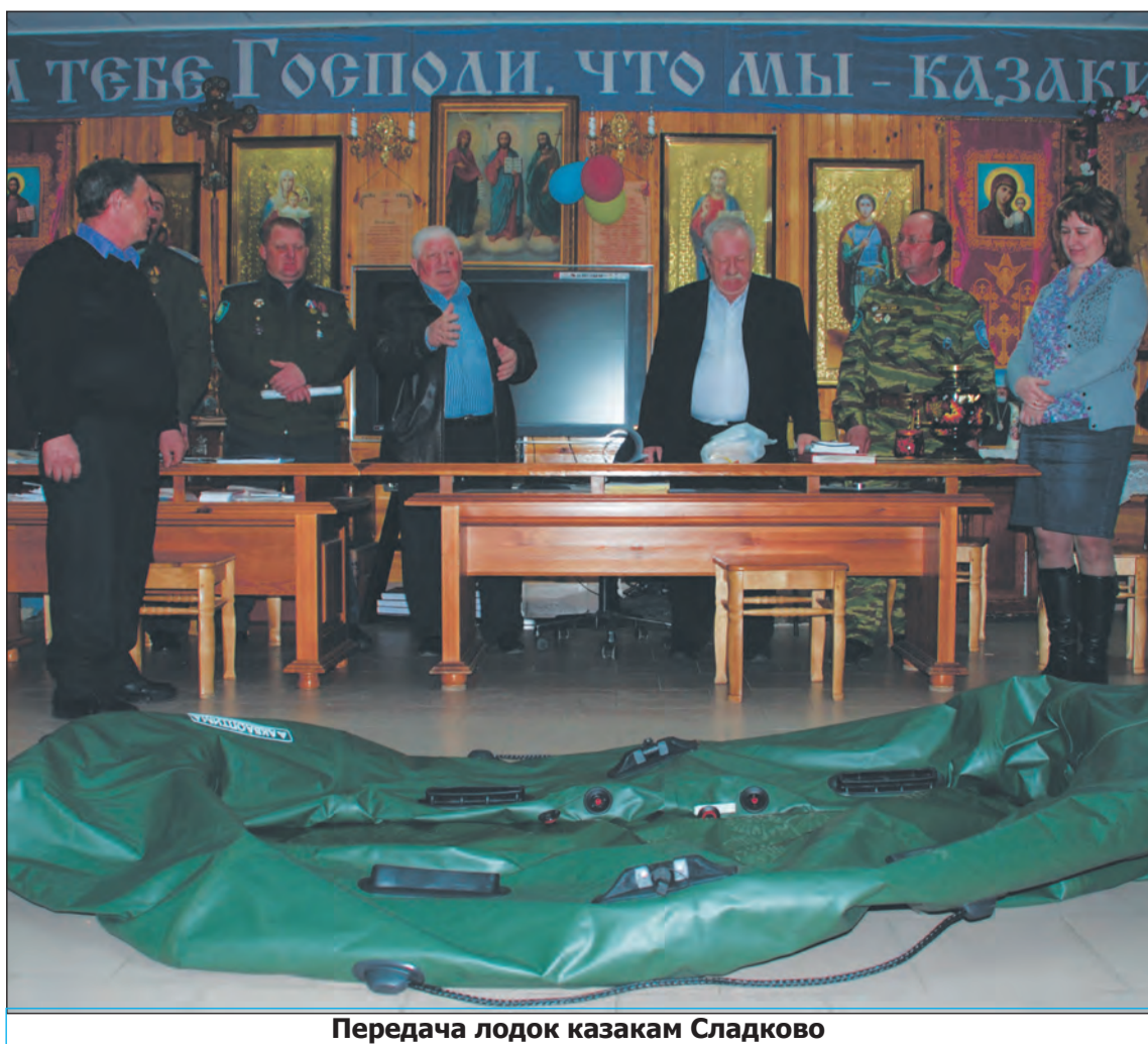
Передача лодок казакам Сладково