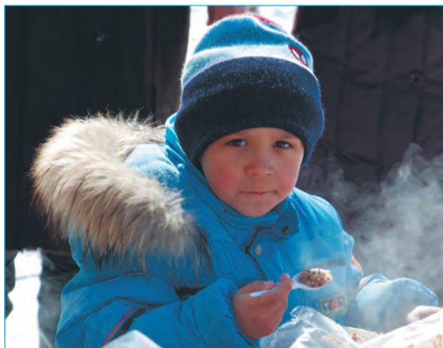
Какая вкусная каша!