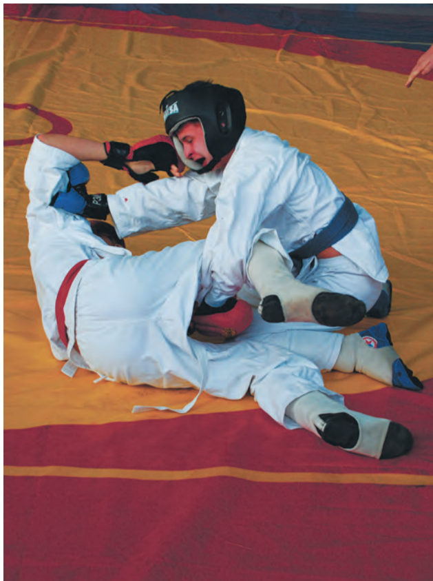
В пылу схватки