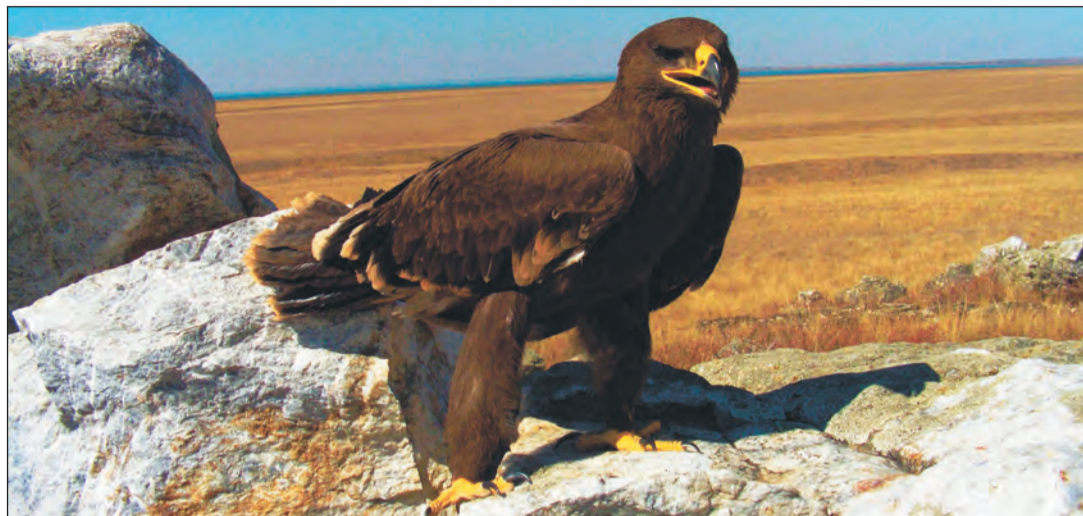
Степной орёл. ( Aquila nipalensis )