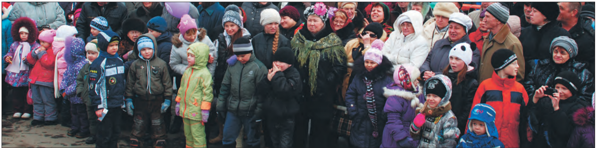
Гости на казачьей масленице