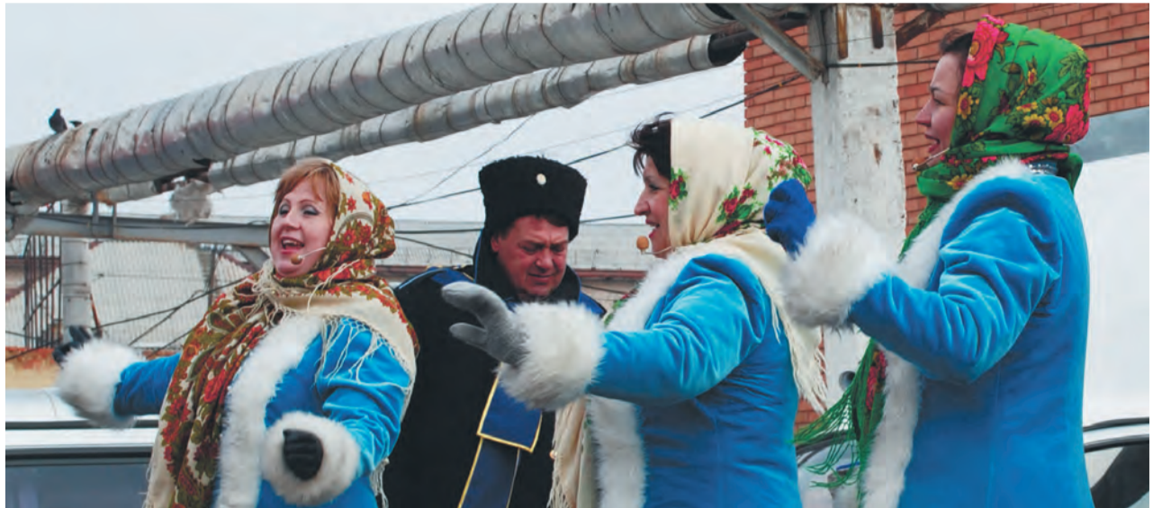
Ансамбль казачьей песни «Яик»

В течение всего праздника для гостей казачьей масленицы выступал народный ансамбль казачьей песни «Яик». Каждый желающий мог поздравить собравшихся с праздником, и этой воз-