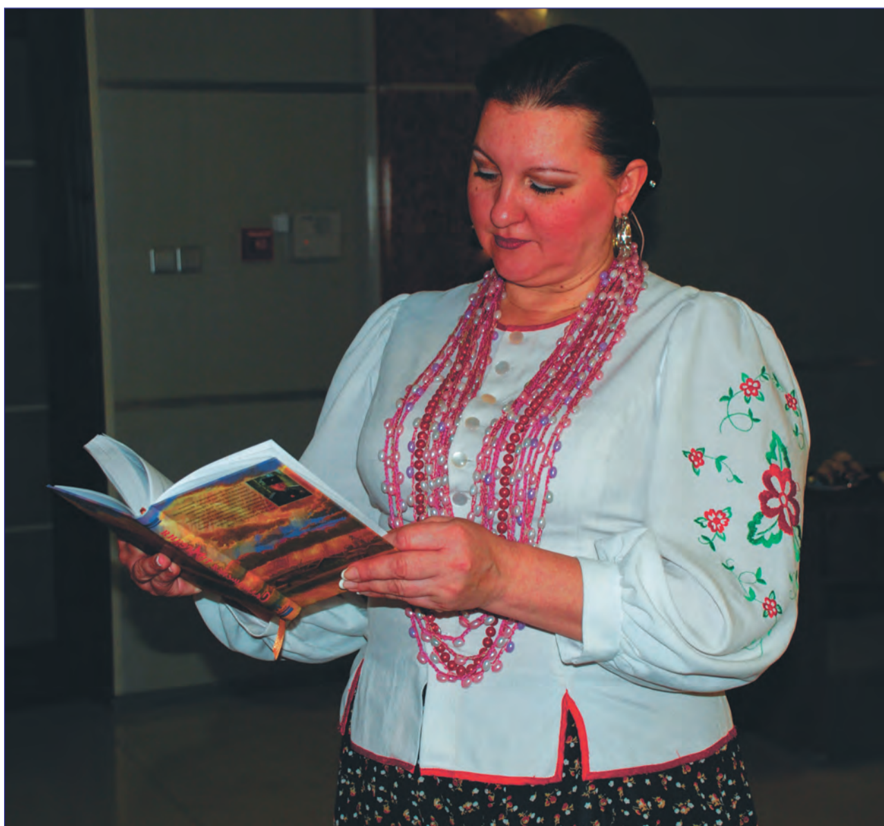
На презентации «Салмышской трагедии»