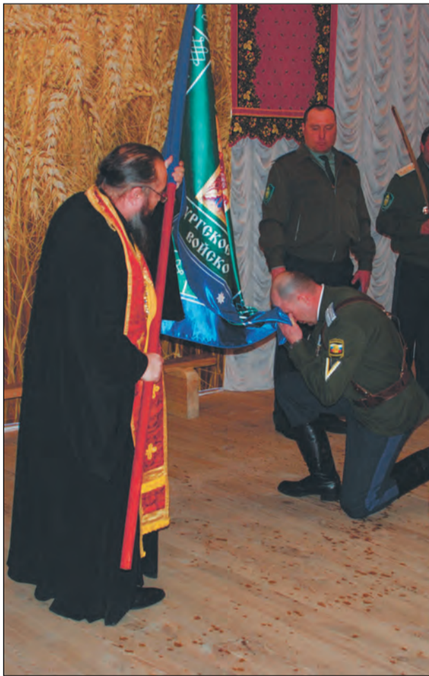
Коленопреклоненный атаман у знамени

После окончания церемонии прививки знамени казачьего об-