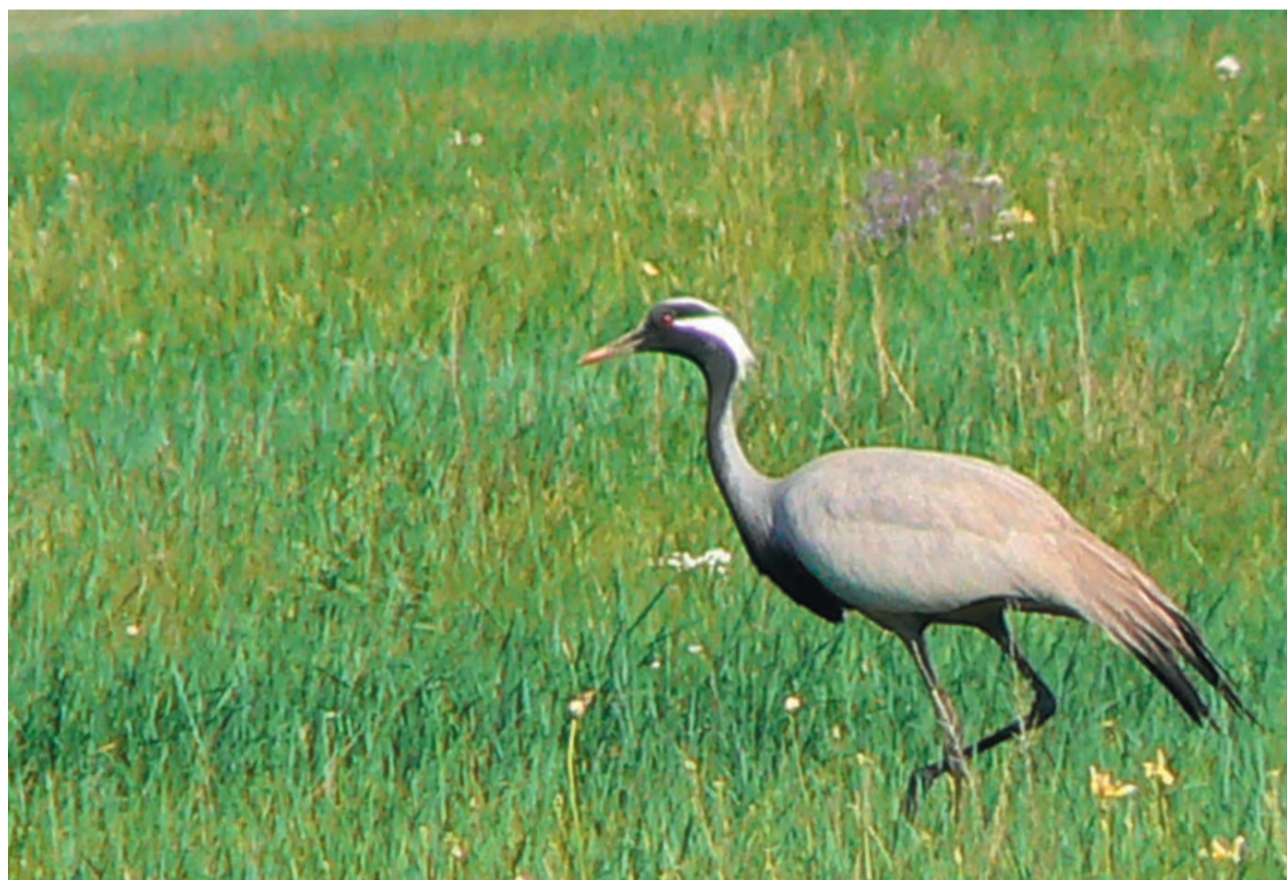
Красавка ( Anthropoides virgo )

КРАСАВКА относится к отряду журавлеобразных, семейство журавлей. Птица средних размеров, шея и ноги длинные, клюв такой же длины, что и голова. В полете шея вытянута, ноги выступают за хвост, могут парить. Оперение серо- сизое. Бока головы, горло и шея спереди черные, позади глаз пучки белых перьев. На передней стороне шеи и зобу