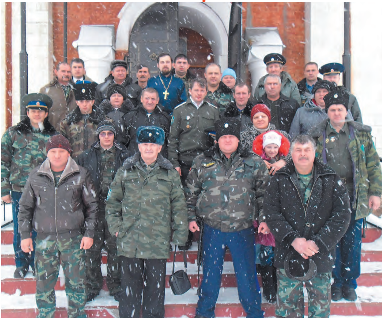
This text only appears in the demo version. This text can be removed with the full version. Changed with the DEMO VERSION of CAD-KAS PDF-Editor ( http://www.cadkas.com ). Казаки ХКО «Луговое» на пороге храма