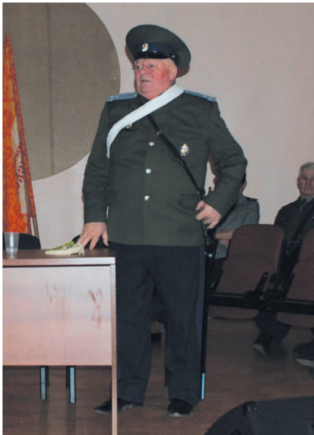
Обращение атамана к Кругу

дает команду: «Садись!». В тех случаях, когда священника невозможно пригласить на Круг, его обязанности возлагаются на выбранного для этих целей казака. Священник может напомнить казакам о христианской морали, когда они нарушают порядок проведения Круга.