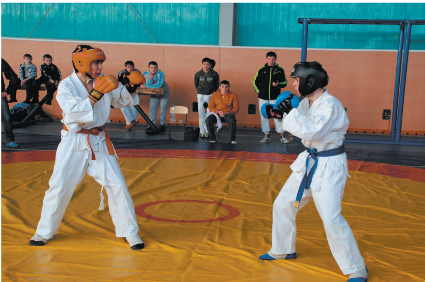
В состоянии боевой готовности

26 ЯНВАРЯ в спортивном зале Черноотрожской средней общеобразовательной школы имени В.С. Черномырдина поселка Черный Отрог Саракташского района прошло первенство Оренбургской области по универсальному бою в возрастных категориях от 14 до 15 и от 16 до 17 лет.