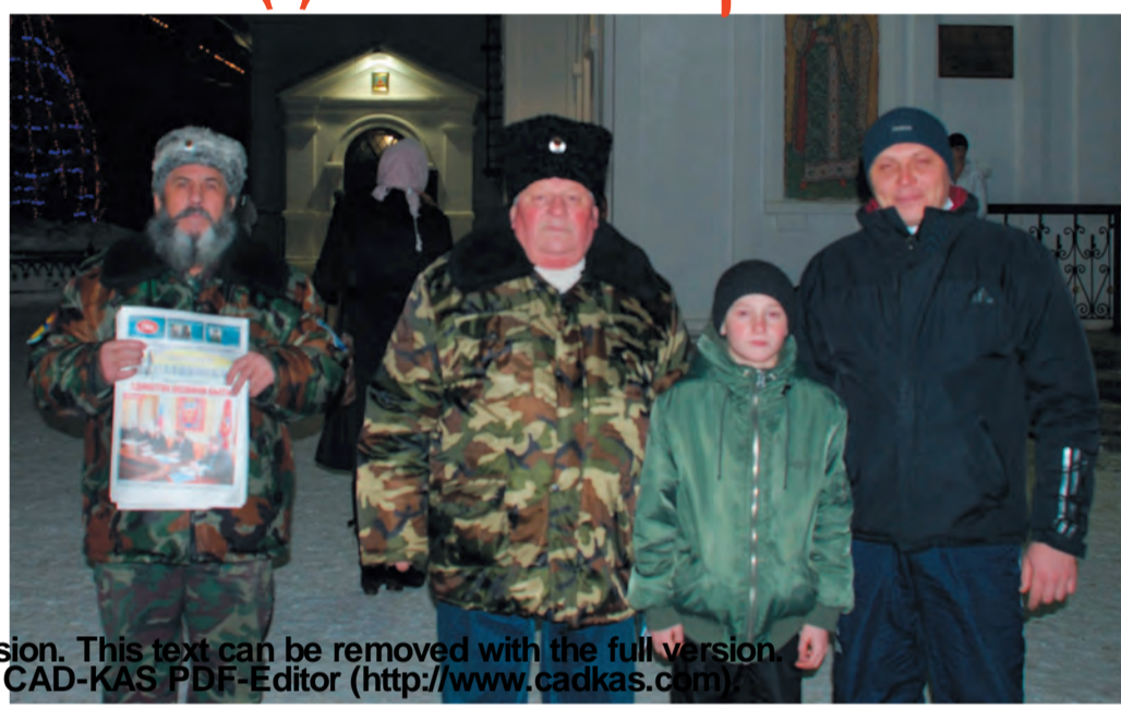
Казаки у Никольского Кафедрального собора пришел Господь.

Но вот еще чему учит нас вся эта история, связанная с Рождеством Христовым и событием вокруг этого рождения: если Господь был принят пастухами, простыми людьми, то не означает ли это, что и мы его сегодня должны искать не там, где блеск и золото, не там, где могущество и сила, а там, где слабость и нужда? Вот почему Господь, обращаясь к своим последователям, говорит о том, что для достижения царствия Божия не-