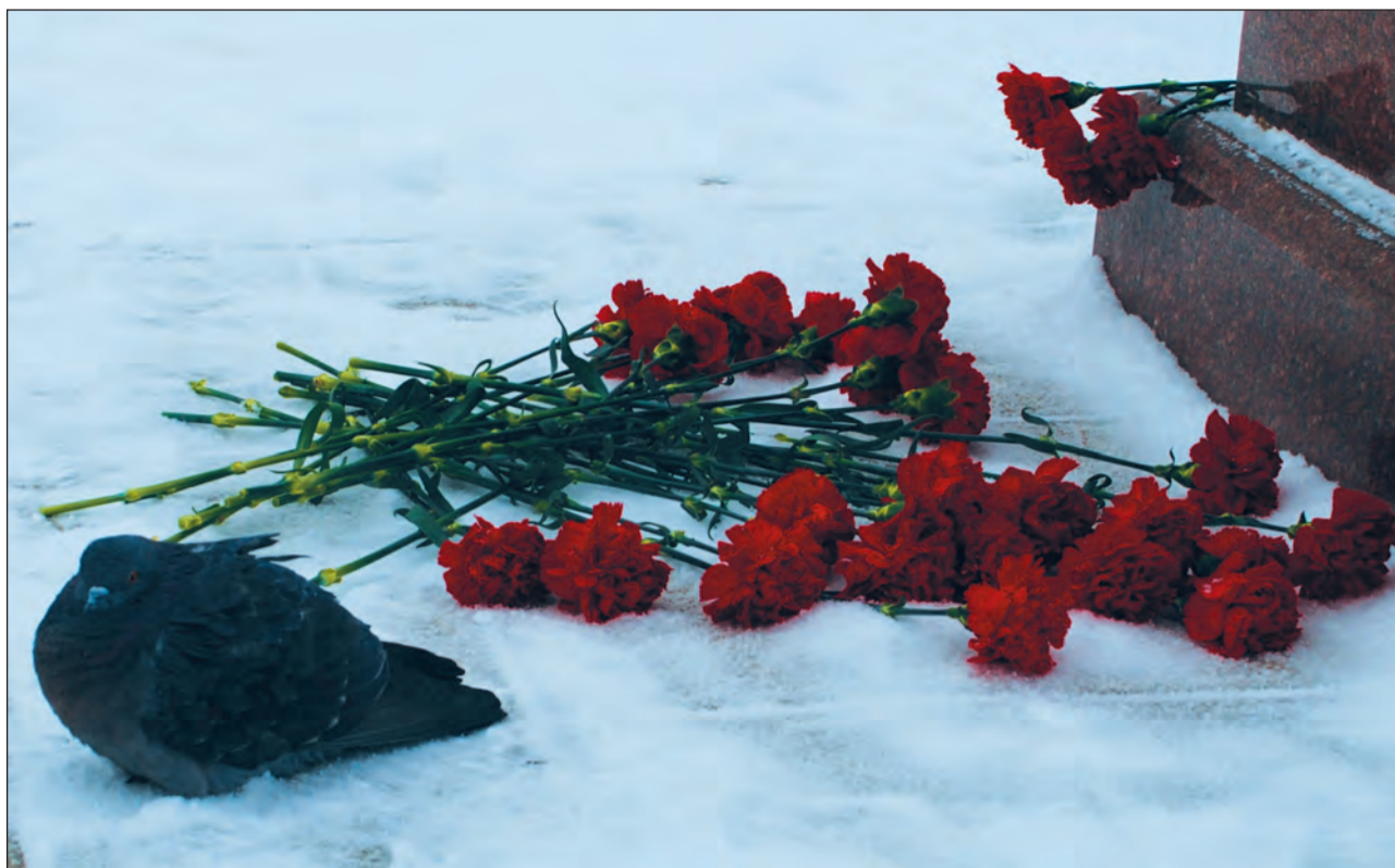
Сизокрылый гость у стэлы Владыки Леонтия