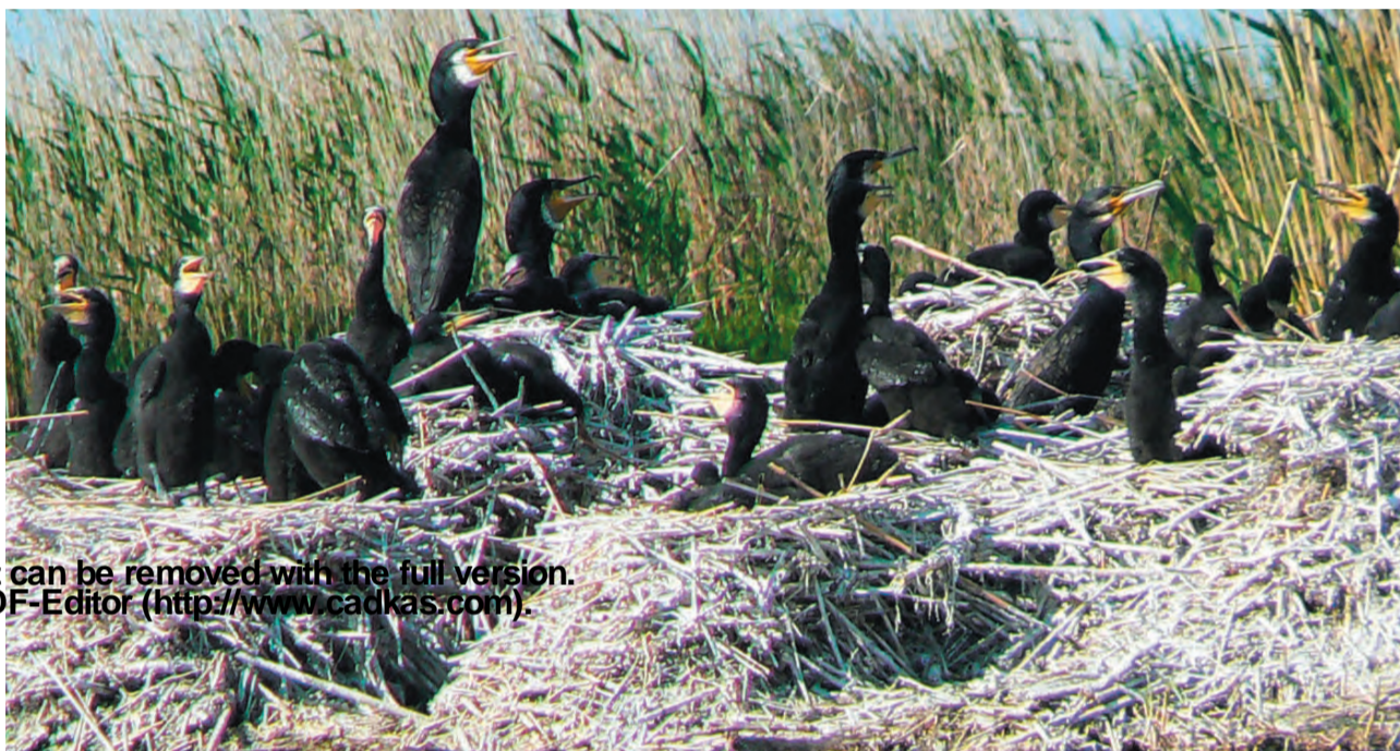
Большой баклан ( Phalacrocorax carbo )

БОЛЬШОЙ БАКЛАН - из отряда веслоногих, птица довольно крупных размеров. Оперение с отливом зелено- бронзового цвета, щеки желтые. Клюв приплюснут с боков, крепкий крючок на вершине помогает удерживать рыбу. В брачный период в области бедра есть белое пятно, хвостовые перья длинные и жесткие. Расположенные ближе к задней части туловища лапы способствуют легкому плаванию и особенно нырянию. Чтобы взлететь, баклану приходится делать разбег. Сам полет легкий, в отличие от гусей маховые движения крыльев чередуются с не продолжительным планированием. Птица имеет способность высушивать крылья, а так как сальные железы плохо развиты, бакланам приходится сушить крылья на воздухе. Гнездятся колониями, устраивая гнездовья по соседству с пеликанами.