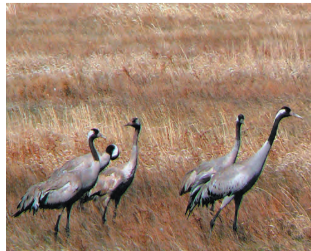
Серый журавль ( Grus grus )

СЕРЫЙ ЖУРАВЛЬ - представитель отряда журавлеобразных, из семейства журавлиных. Довольно крупных размеров птица, с удлиненным клювом, длинную шею и ноги в полете не складывают. Окрас туловища серый, шея сзади и по бокам белая, затылок и задняя часть темени голые, красного цвета. Журавль выбирает для гнездования сухое место, на заболоченных берегах озер, скрытых от глаз человека. При строительстве гнезд, в качестве подстилки используют, сухую траву, рогоз. Как правило, в гнезде два яйца, высиживают оба родителя поочередно. Питаются семенами различных растений, в том числе и культурных, из животной пищи чаще всего поедают насекомых, червей, лягушек, мышей. Серый журавль, как исчезающий вид, занесен в Красную книгу.