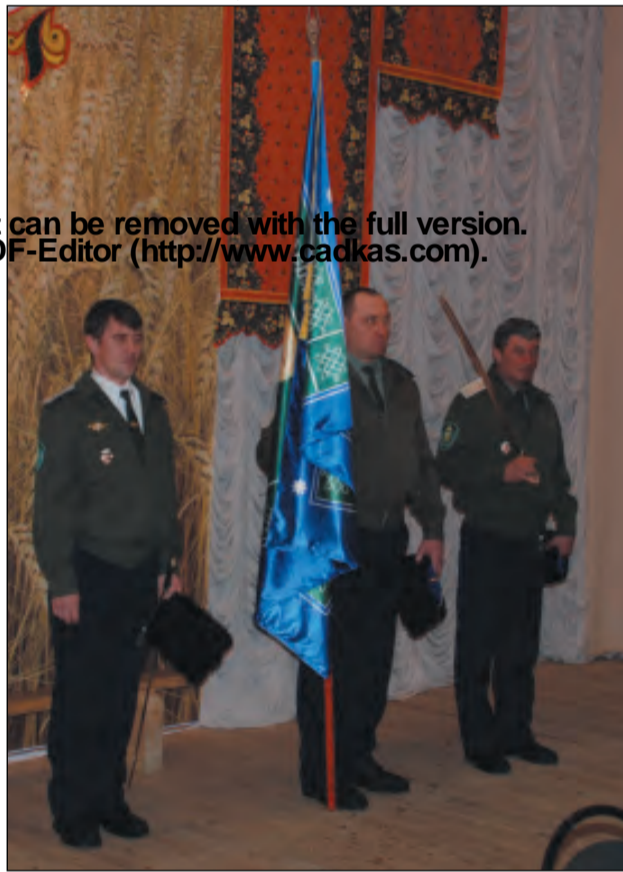
Караул у Знамени на Круге