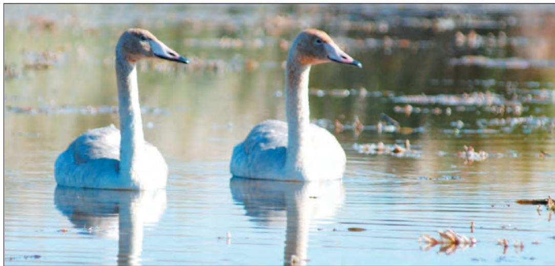
Лебедь- кликун ( Cygnus Cygnus )